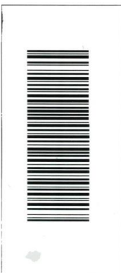
Etiqueta de contra rotulo