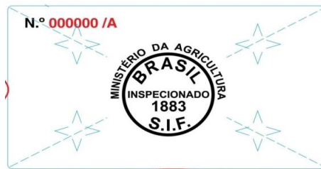
Etiqueta interna e testeira